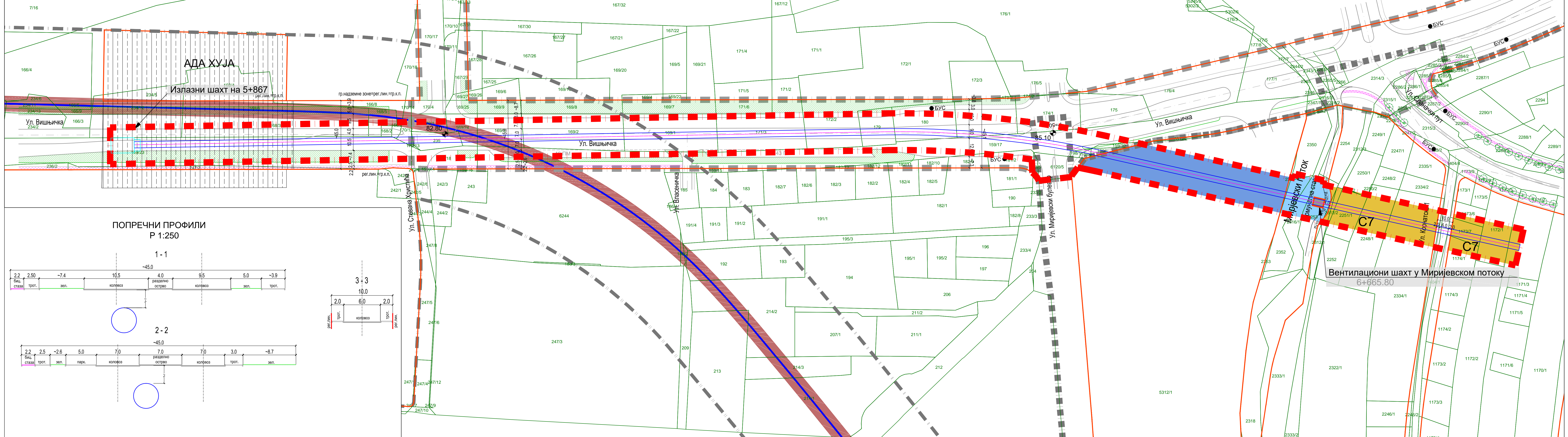
ПОПРЕЧНИ ПРОФИЛИ Р 1:250